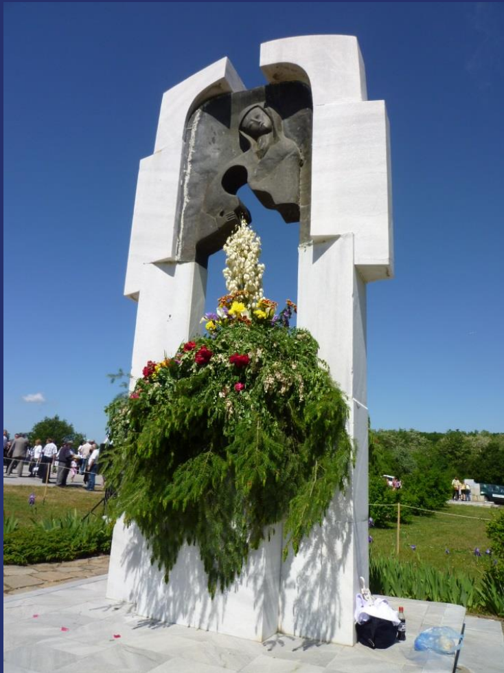
Илиева нива, Ивайловградско