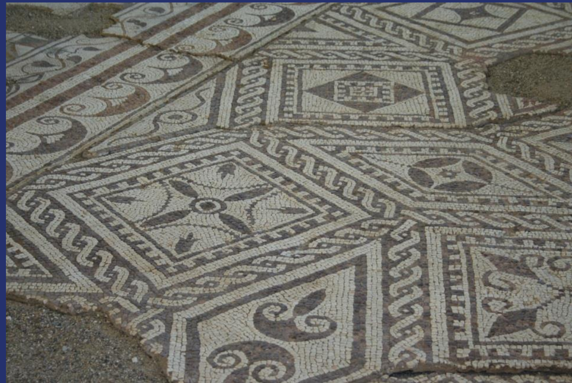
Римска вила „Армира“, Ивайловградско