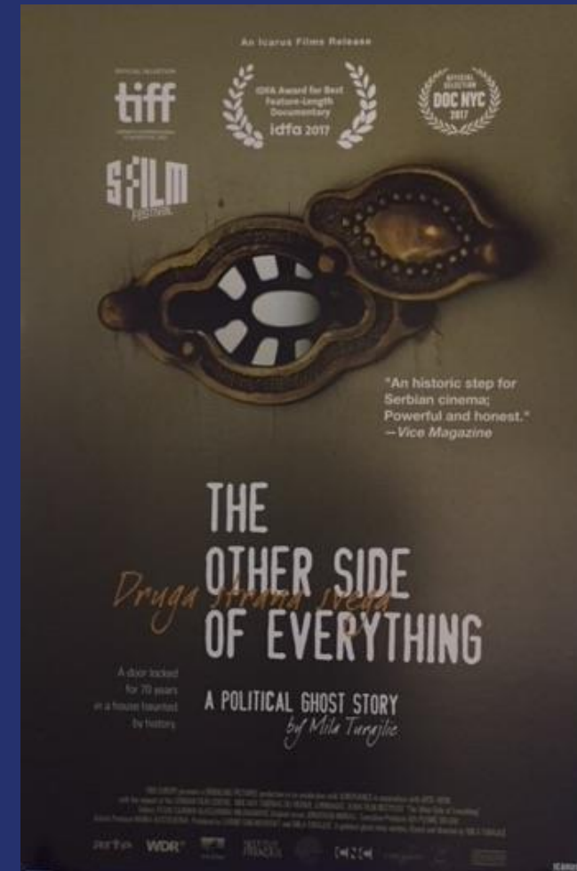
Печели голямата награда за най-добър филм - ИДФА 2017 г.