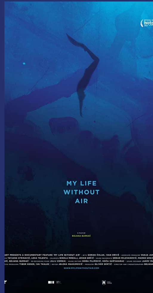
Световна премиера Хот Докс 2017