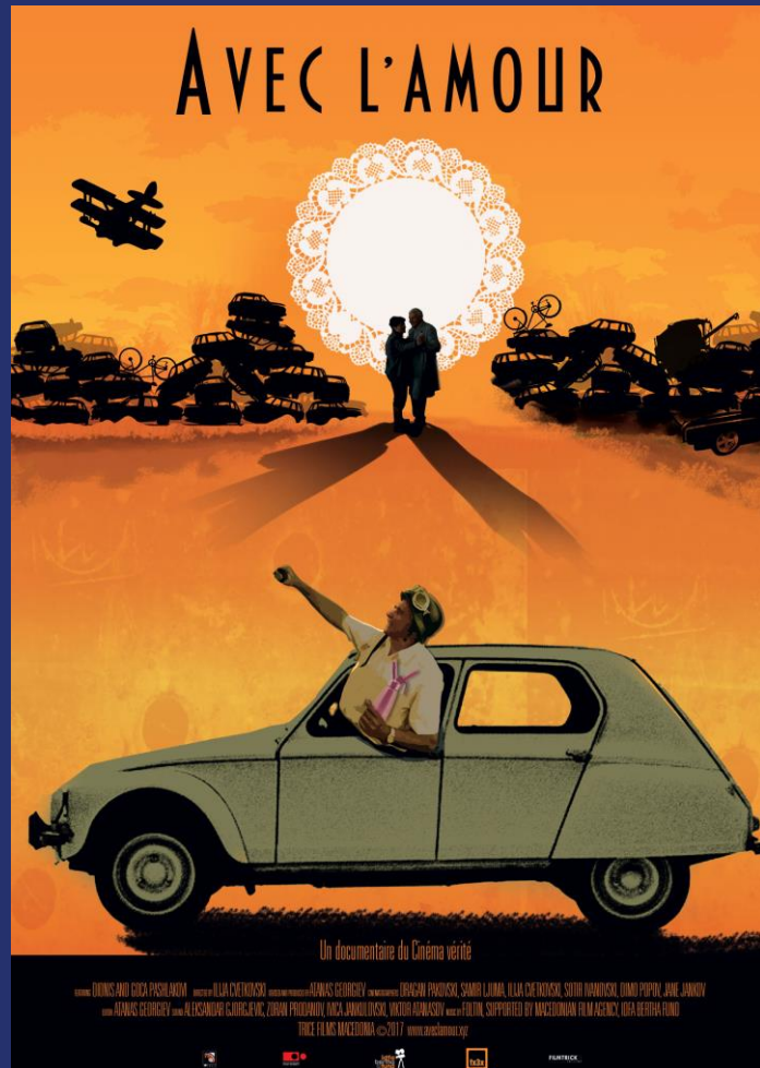
Световна премиера Хот Докс 2016